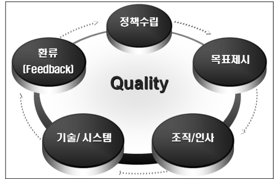
(그림 1) 서비스 품질 인증평가 프로세스

클라우드 서비스 인증제의 인증 종류는 ‘클라우드 서비스 인증’과 ‘클라우드 서비스 우수 SLA 인증’의 두