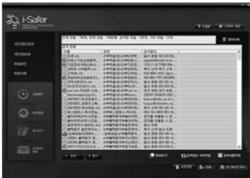
(그림 3) i-Safer의 개인정보 검색

개인정보 검색기능은 그림 3처럼 주민등록번호, 외국인등록번호, 면허 번호, 전화번호, 여권번호, 사업자등록번호, 계좌번호, 이메일, 신용카드, 주소, 새주소 등의 패턴으로 검색이 된다. 또한 다양한 종류의 전자문서 지원하며, ZIP, 7Z, ALZ, BZ2, RAR등 압축파일 검색도 가능하다. 뿐만 아니라 검색한 파일정보를 DB에 저장하여 재검색시 빠른 검색을 할 수 있다.