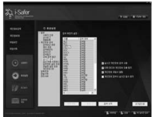
(그림 6) 실시간 감시하여 경고 메시지

안 인식과 자신의 PC관리이다. PC보안(내부정보 유출 방지)은 최근 서버 이외에 PC의 해킹사고가 증가하고 있고 PC보안사고 대부분이 내부자에 의한 자료 유출 및 위·변조 등의 피해사고로 그 필요성이 커지고 있다. PC의 개인정보나 산업기밀 자료를 암호화 및 파일 숨김, 완전 삭제를 하여 안전하게 관리를 하게 되면 개인정보보호법 및 대응이 가능하며 유출을 최소화 할 수 있을 것이다.