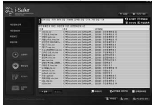
(그림 4) 파일의 암호화