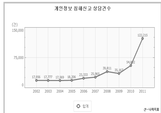
(그림 1) 개인정보 침해신고 상담건수

2011년도 개인정보 침해건수는 총 122,215건으로 전년대비 약 1,228.8% 증가 하였다. 이는 2011년도에 주민등록번호 클린센터('10.7월 이후) 영향으로 동의절