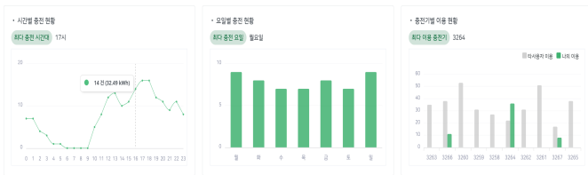
그림 1. 이용자의 충전패턴

그림 1은 이용자의 시간대별, 요일별, 충전기별 충전패턴을 나타낸다. 해당 이용자의 최대 충전 시간은 17시이며, 일요일에 75kWh를 충전하여 가장 많이 충전한 것으로 나타났다. 하지만, 요일별 충전 편차는 크지 않아 짧은 주기로 자주 충전하는 경향이 있을 것으로 추정된다. 또한, 단지 내 10기 충전기 중에 3기 충전기를 주로 사용하며, 선호 충전기는 3264 충전기를 36회 이용한 것으로 나타났다. 특히, 해당 충전기는 타 사용자에 비해 충전기 이용 빈도가 매우 높다는 것을 확인할 수 있다.